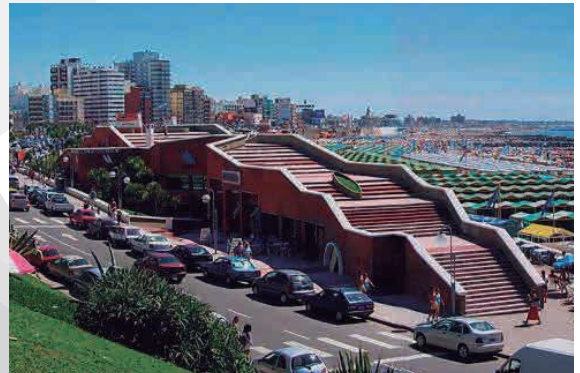
MAR DEL PLATA PLAYA LA PERLA