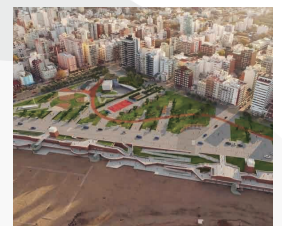
PLAZA ESPAÑA Y LA PERLA